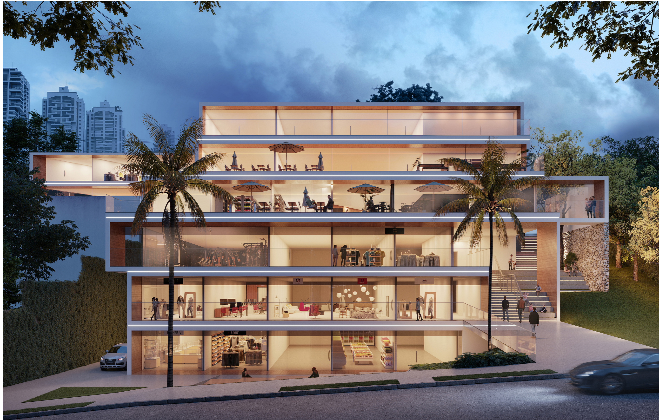
Fachada Rua Fausto Nunes Vieira