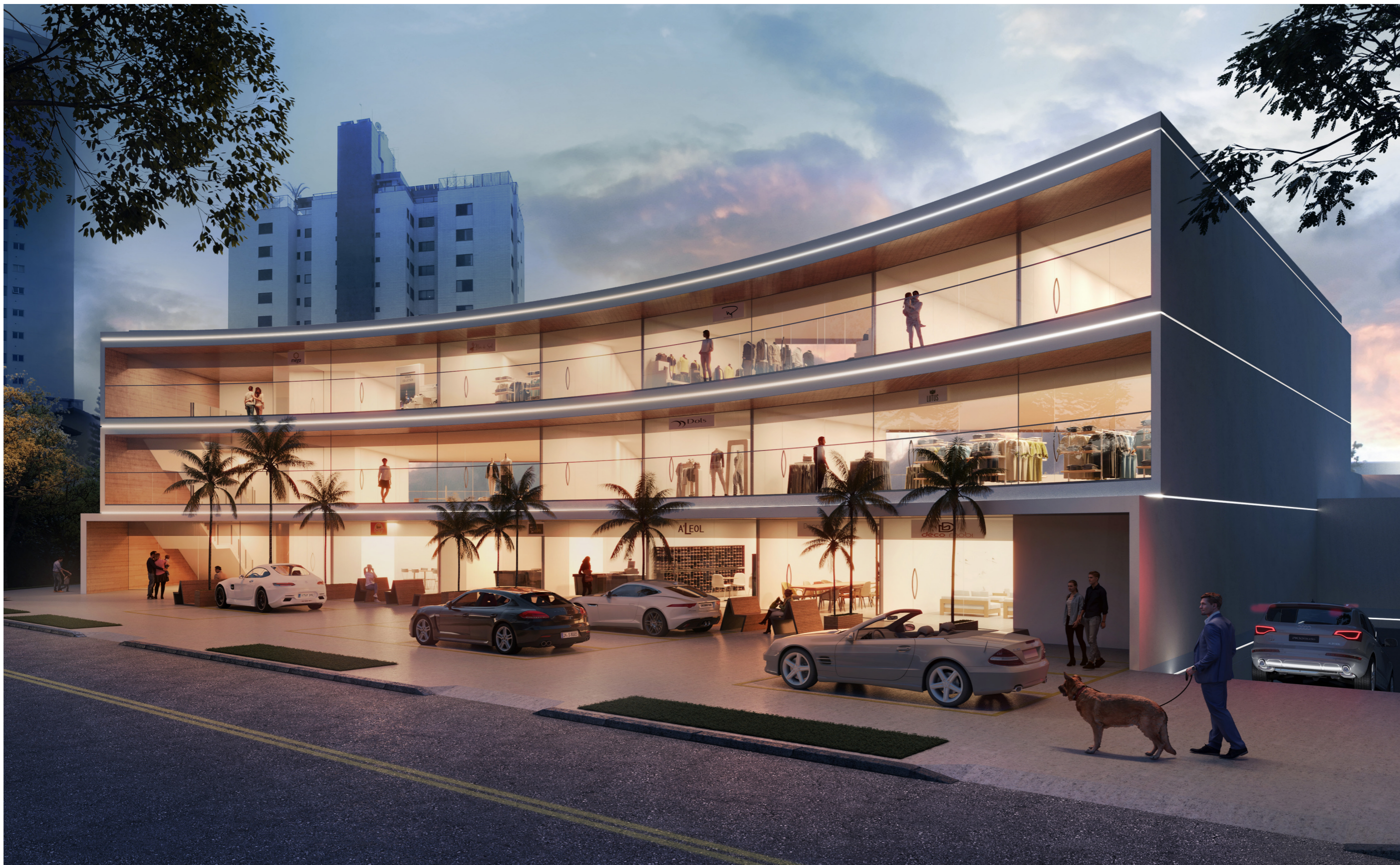
Fachada Rua Severino Melo Jardim